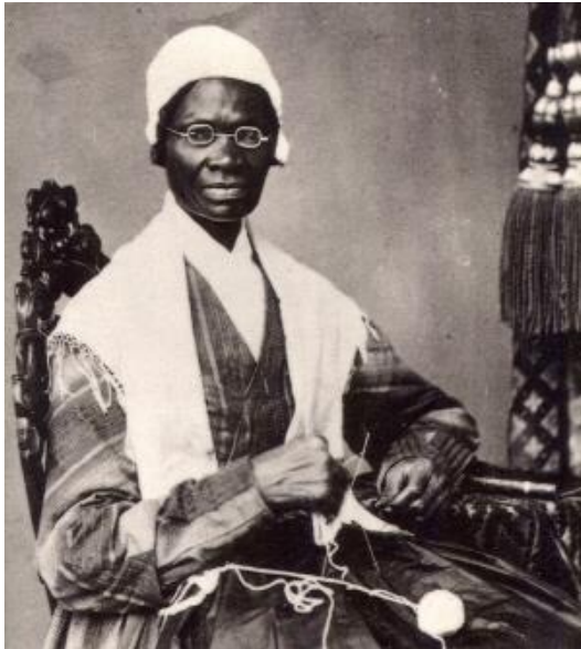
Sojourner Truth (1798- 1883)