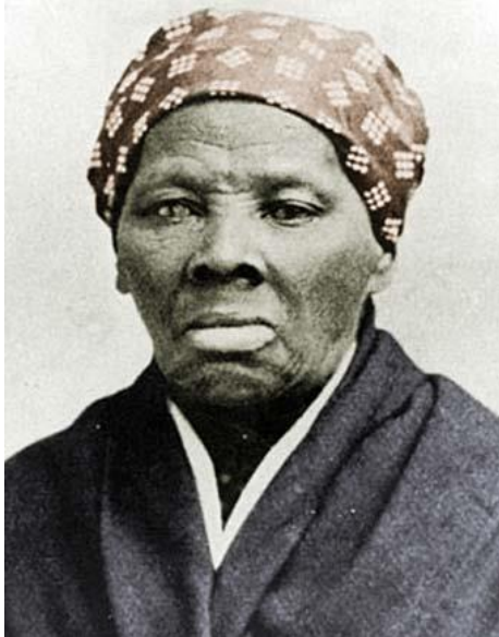
Harriet Tubman (1822- 1913)

die damalige Frauenbewegung. Nach dem Krieg kämpfte er dafür, dass die befreiten Sklaven die gleichen Rechte wie alle Amerikaner bekamen und bekleidete eine große Anzahl öffentlicher Ämter. Douglass war jemand, der einen starken Glauben hatte, dass alle Menschen gleich sind, egal, ob schwarz, weiß, männlich, weiblich, ob geborener oder zugewanderter Amerikaner. Er stand zu seiner Aussage: „Ich bin bereit, mich mit jedem zusammen zu tun, der Gutes tun möchte, und mit niemandem, der Böses vorhat.“