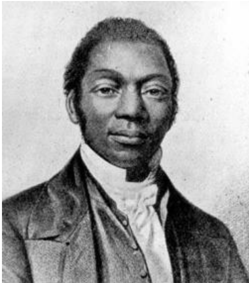
Dr. James W.C. Pennington (1809- 1870)